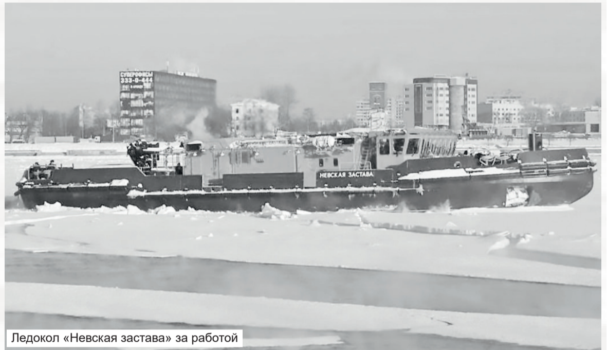
Ледокол «Невская застава» за работой

Например, на острове Гогланд построили гостиницу, причальный комплекс для яхтсменов. Когда проектировали, думали, что удастся создать здесь упрощённый режим доступа и пребывания и можно будет открывать на острове и дома