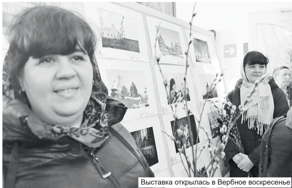
Выставка открылась в Вербное воскресенье