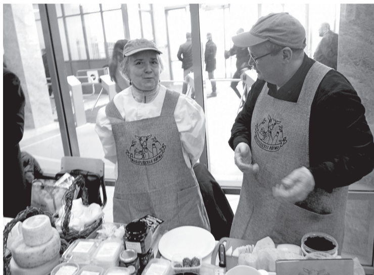
Дегустация продукции стала традицией съезда фермеров

— В рамках контракта жители могут приобрести сельскохозяйственную технику, семена и животных. Сроки рассмотрения заявления очень небольшие — всего месяц. А получить можно