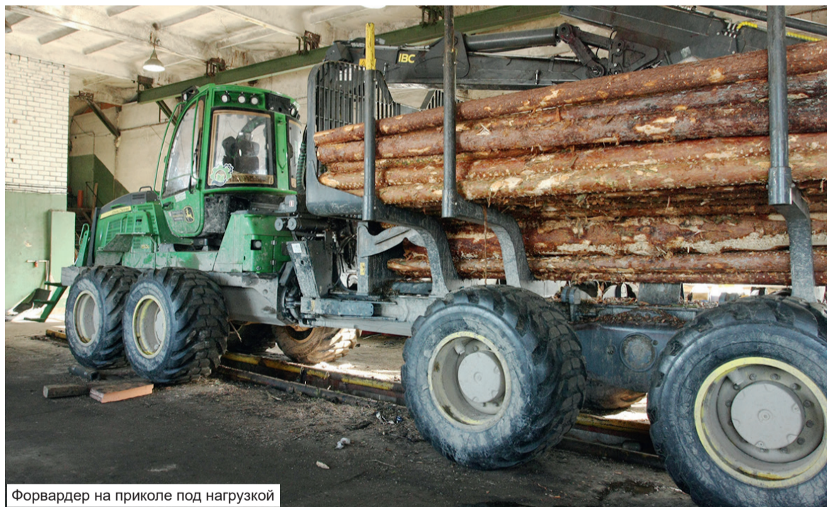
Форвардер на приколе под нагрузкой