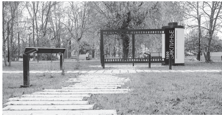
Заклинье. Центральный сквер после благоустройства

Интересное наблюдение: если взглянуть — какие районы голосуют активнее всего, то каждый год картина меняется. В этом году активнее других были жители Бокситогорского, Волховского и Тихвинского районов. А в прошлом лидировали Всеволожский, Гатчинский и Кировский. Возможно, это связано с тем, что жители