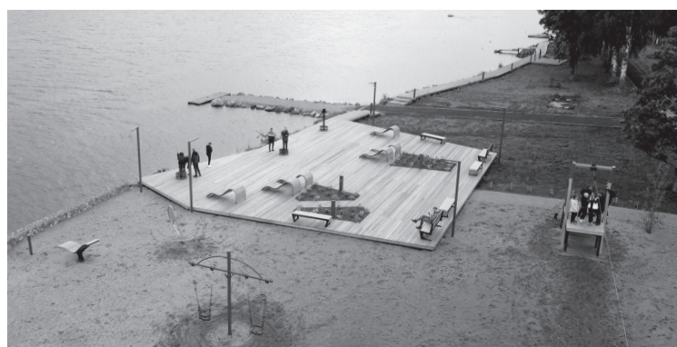
А так выглядит обновлённая Свирская набережная в Вознесенье

ческого оформления. Их часто путают. Идентичность можно подчеркнуть через формы, цвет, материалы, уникальные элементы, интеграцию символов места в современные объекты городской среды. Мы не говорим про брендирование всего и вся: обилие логотипов, гербов и других символов поселения не является способом создания идентичности.