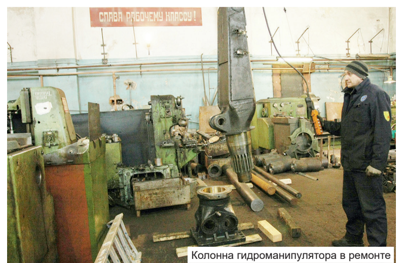
Колонна гидроманипулятора в ремонте

Напомним, что в лесах Подпорожского района растёт четыре основные породы, используемые в хозяйственной деятельности: осина, берёза, ель и