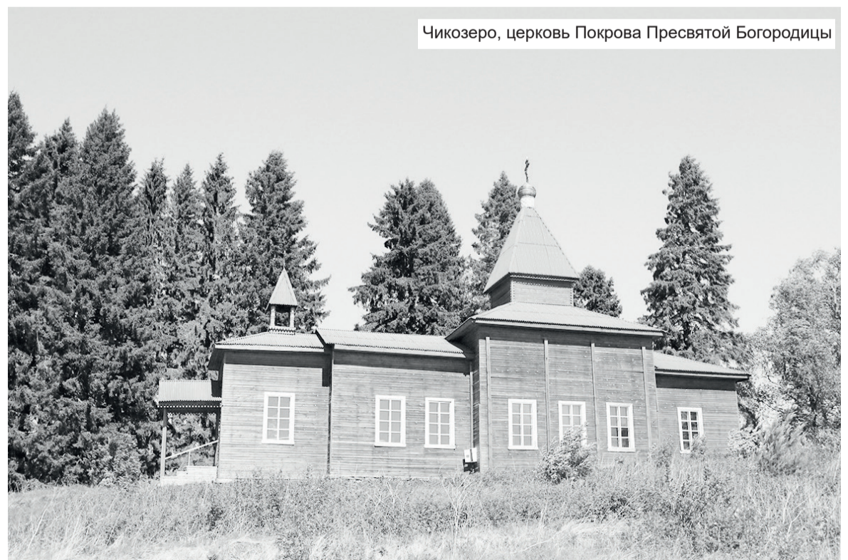
Чикозеро, церковь Покрова Пресвятой Богородицы