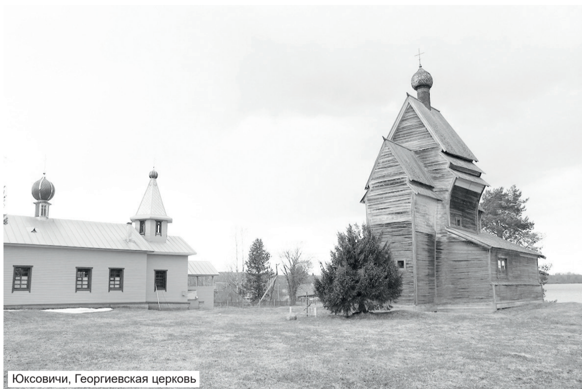
Юковичи, Георгиевская церковь

Древнее гнездо Согиницы вобрало в себя деревни по обе