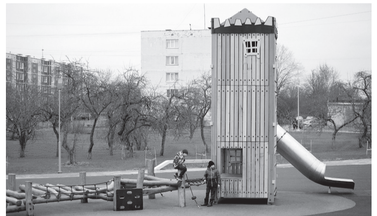
В рамках программы поселения получают новые детские площадки

Важно отделять идентичность территории от темати-