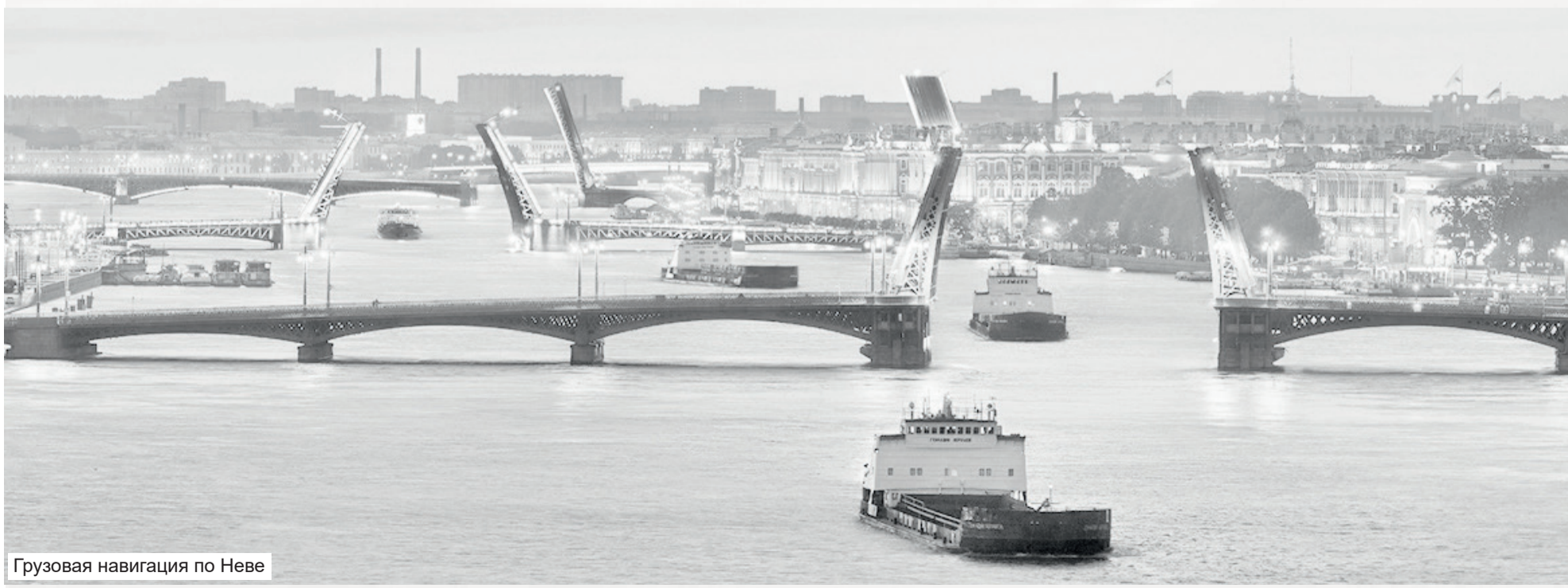
Грузовая навигация по Неве